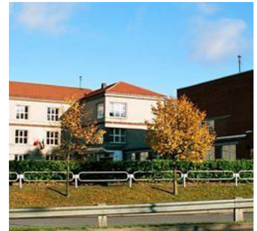
Klaipėdos „Saulėtekio“ pagrindinė mokykla

Kviečiame mokytis mokykloje, kurioje kiekvienas gali atrasti save